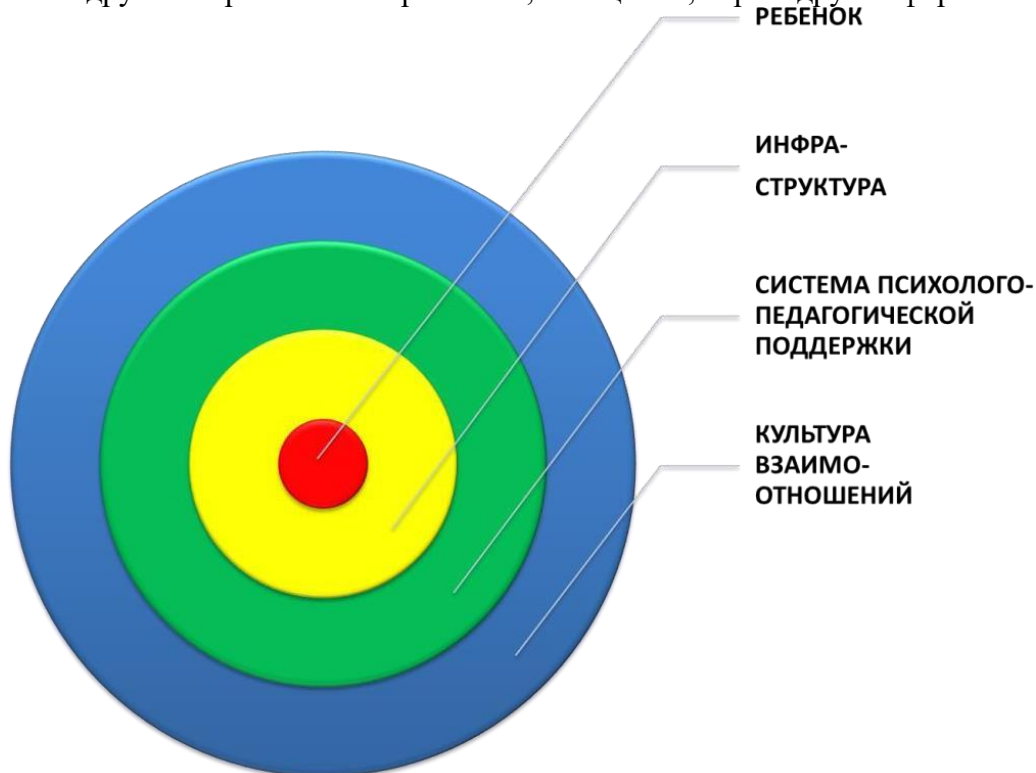
Схема Модели РППС «Журавлёнок»

Структурирование РППС «Журавлёнок» под задачи воспитания, развития и социализации детей является весьма условным и представляет собой мобильные, трансформируемые под сюжеты и замыслы педагога и инициативы детей Зоны (центры и т.д.), куда аккумулируются и перемещаются мебельные модули, материалы, средства, которые условно можно разделить на места: